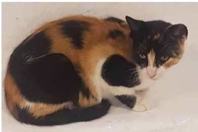
Abb.: Glückskatze mit dreifarbigem Fell 1 : Die Katze besitzt die Fellfarben orange und schwarz, deren Gene auf dem X-Chromosom vererbt werden. Durch die X-Inaktivierung entsteht ein Zellmosaik, weshalb beide Farben vorliegen. Dazu kommt weiße Färbung, die Autosomal durch ein „white spotting“ Allel verursacht wird.

Die Auswirkung der X-Inaktivierung und das zugrundeliegende Zellmosaik können besonders gut bei sogenannten Glückskatzen (Abb), die schwarz, orange und weiß sind, beobachtet werden.